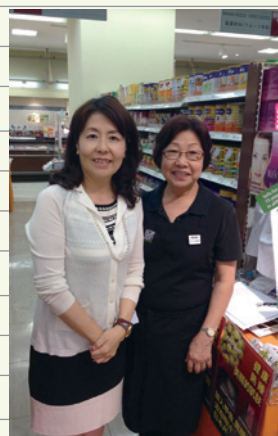
とても70歳には見えませんか?

今年お世話になったマネキンの女性はベテランで売り上手。彼女の中国語訛りの英語と僕たちのカタコト英語で意思疎通率は50%でしたが、彼女のおかげで現場は楽しく、売上も好調でした。で、身分証明書を見てビックリ!…彼女、70歳でした。