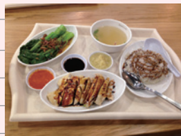
シンガポールのチキンライス

日本のチキンライスはケチャップ味が大好きですが、シンガポールのは茹でた鶏の出汁でご飯を炊いて、その上にドンとチキンが乗っています。香辛料が効いた東南アジア独特の味付けで…苦手でした。