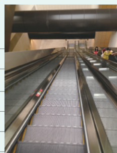
地下鉄へのエスカレーター